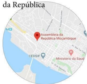
Assembleia da República