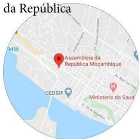
Assembleia da República